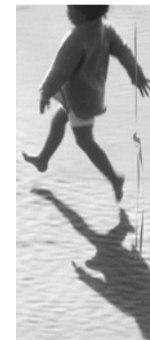
Graphisme : Prunelle Giordano

Julius Von Bismarck, Punishment , 2011-2012