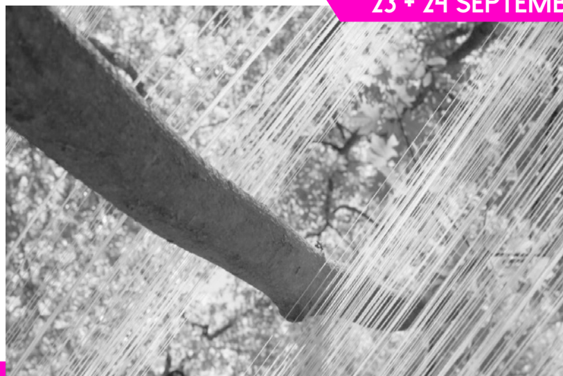
LA PETITE ESCALÈRE

S'inscrire au préalable par e-mail : contact@coop-bidart.com