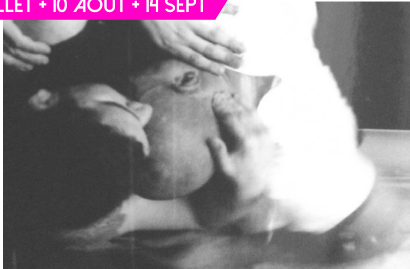
photographie (détail) : Maider Elcano